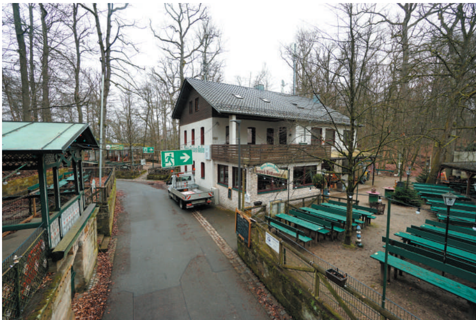
Wirtschaftsgebäude, Ansicht von Südwesten