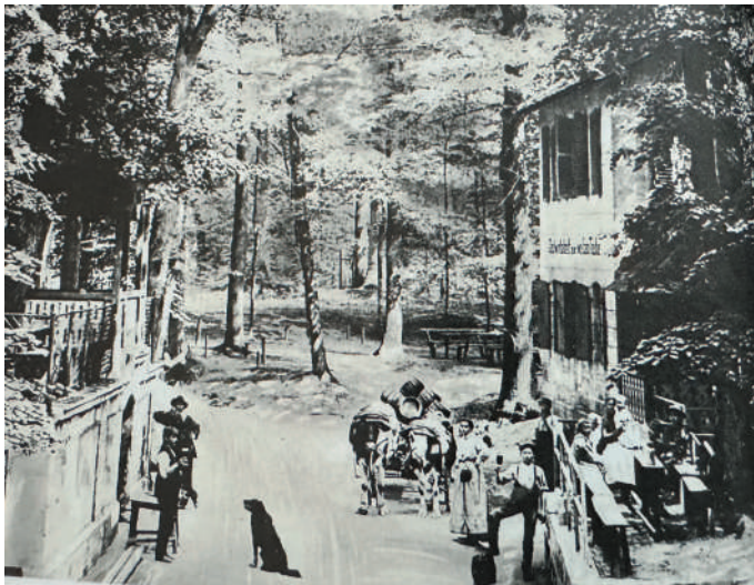
Weiß-Tauben-Keller um 1900 (Glas 2019, 334)