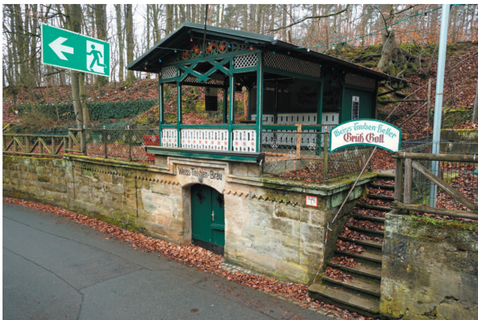
Ansicht des Kellereingangs von Nordosten