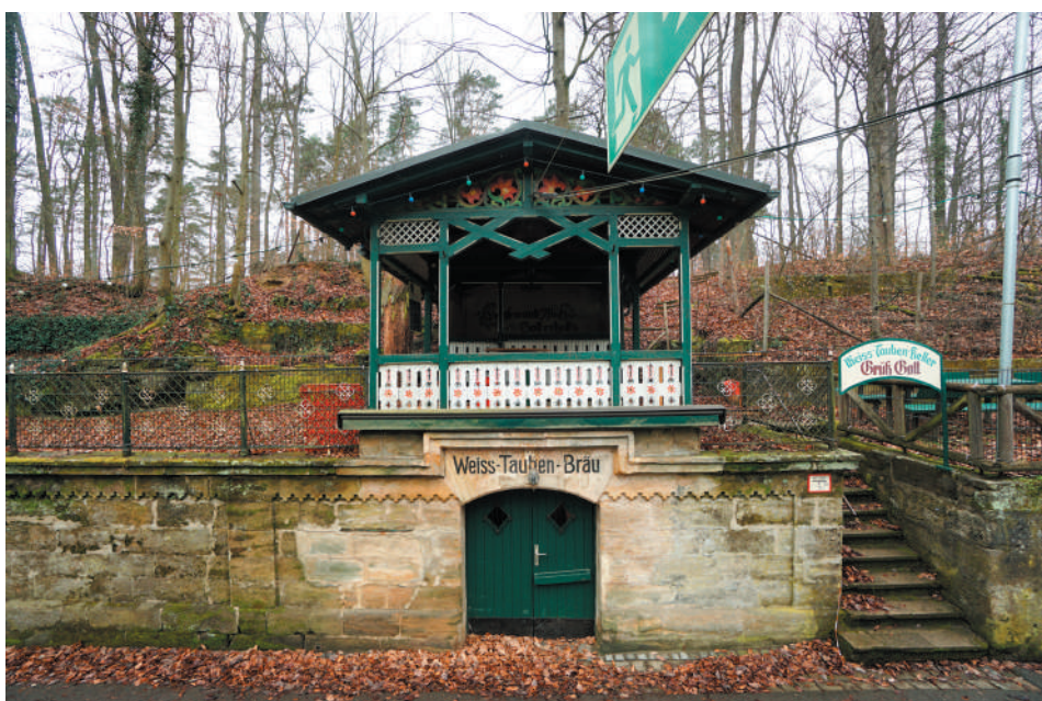
Zugang zum Felsenkeller mit darüberliegendem Salett