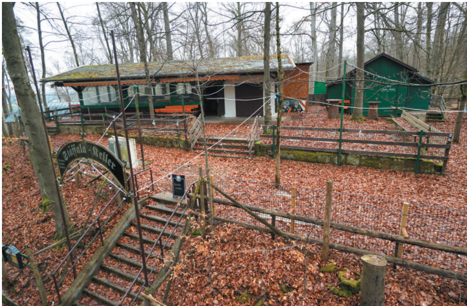
Freischankfläche des Stäffala-Kellers mit Bebauung auf dem Hügelrücken