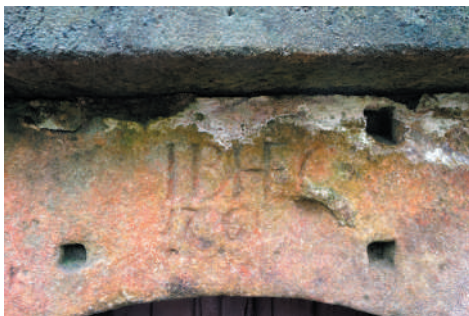
Inschriftenstein auf dem Sturz am Kellereingang