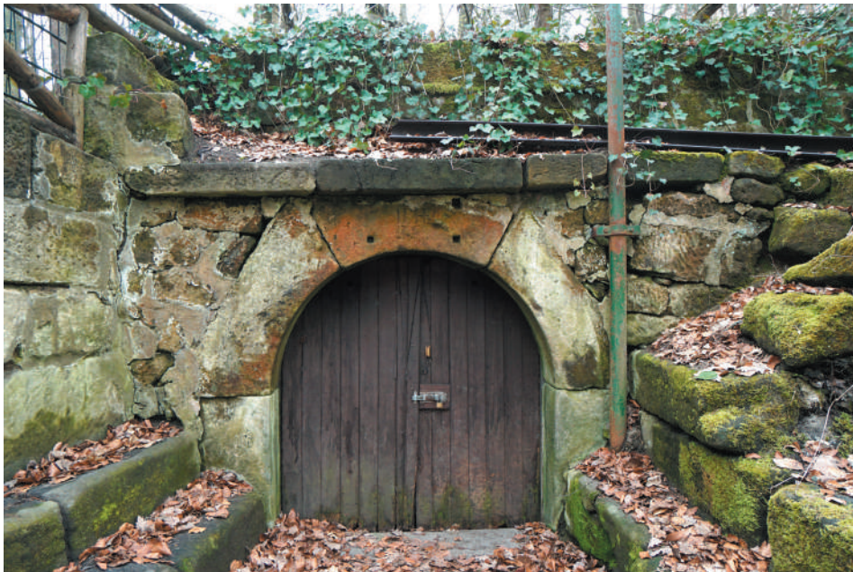
Eingang in den Kellerstollen