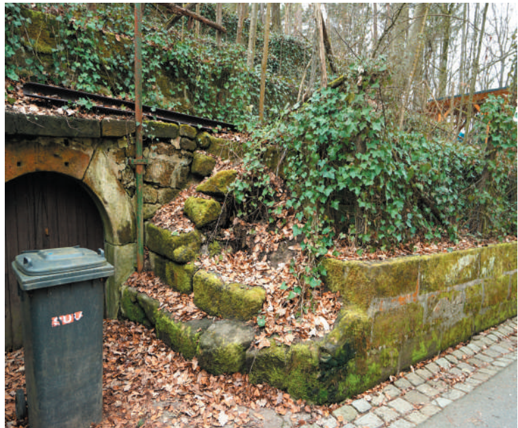
Vorgesetzte Terrassenmauer vor dem Kellereingang, © memvier 2023