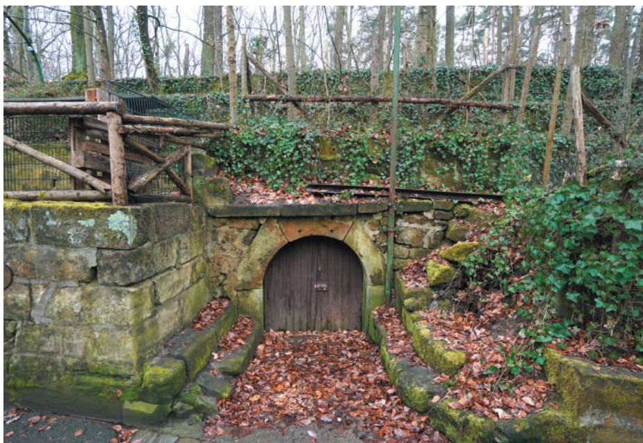
Eingang zum Felsenkeller, Ansicht von Osten