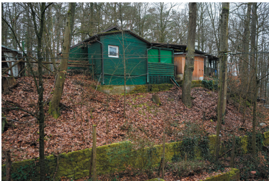
Rückseite der Bebauung auf dem Hügelrücken, Ansicht von Nordosten