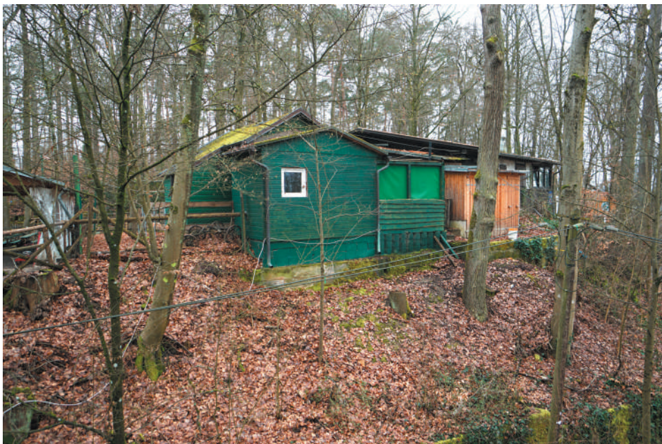
Rückwärtige Ansicht der Kellerbebauung