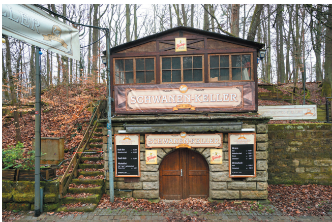
Kellereingang, Ansicht von Nordosten