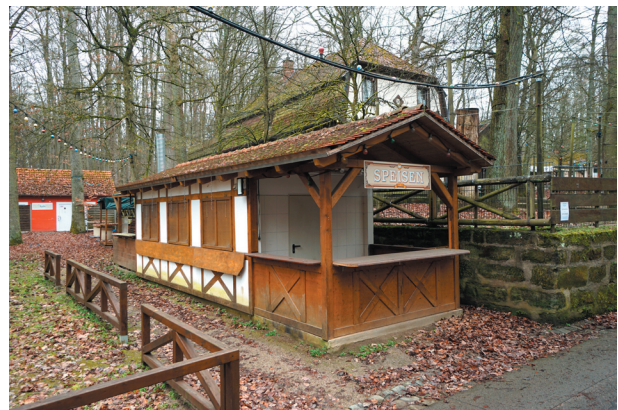
Schankhaus, Ansicht von Nordwesten