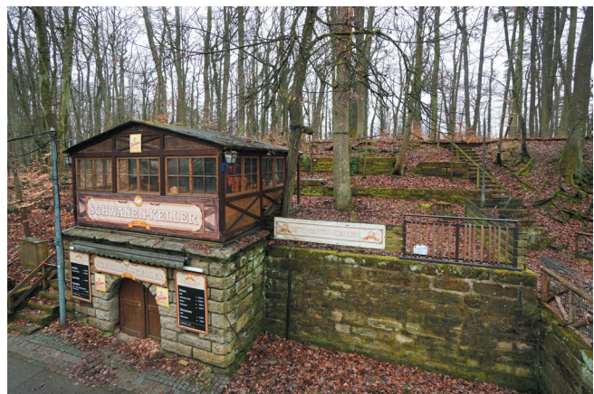
Kellereingang, Ansicht von Norden, © memvier 2023