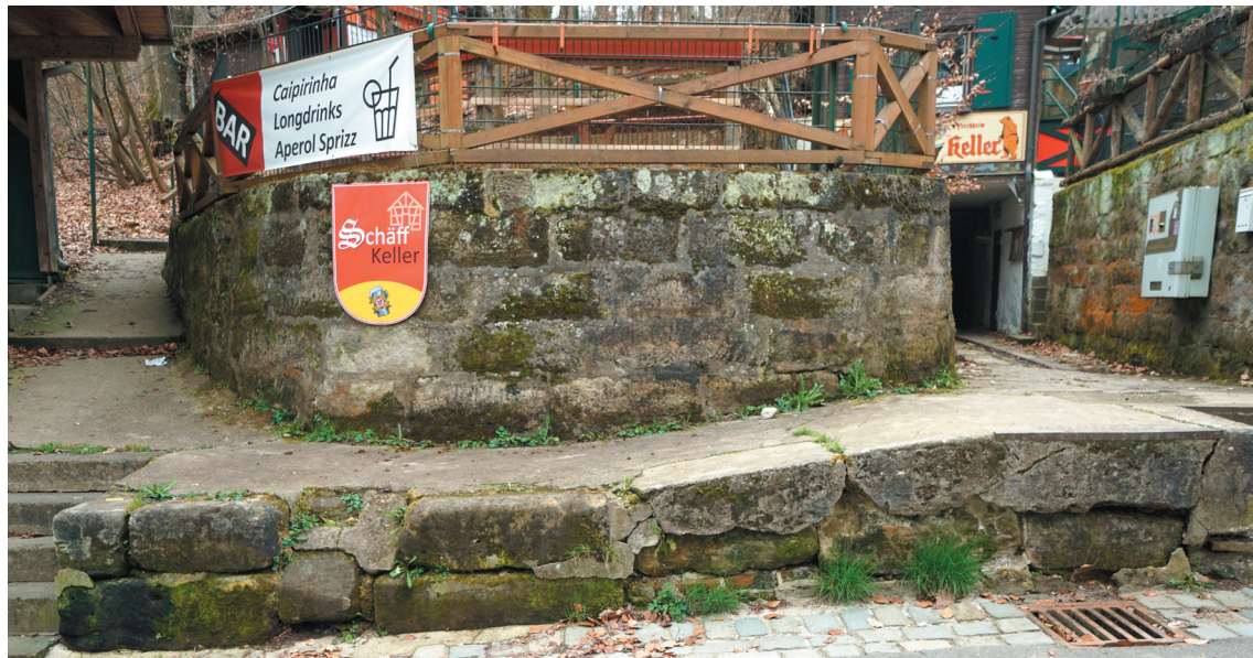
Terrassenmauern an der unteren Kellerstraße