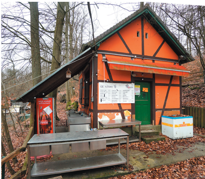
Kellerhaus, Ansicht von Westen

Schäffbräu-Keller mit dem 1896 erbauten Schankhäuschen, das heute nicht mehr erhalten ist, 1908. (Glas 2019, 298)