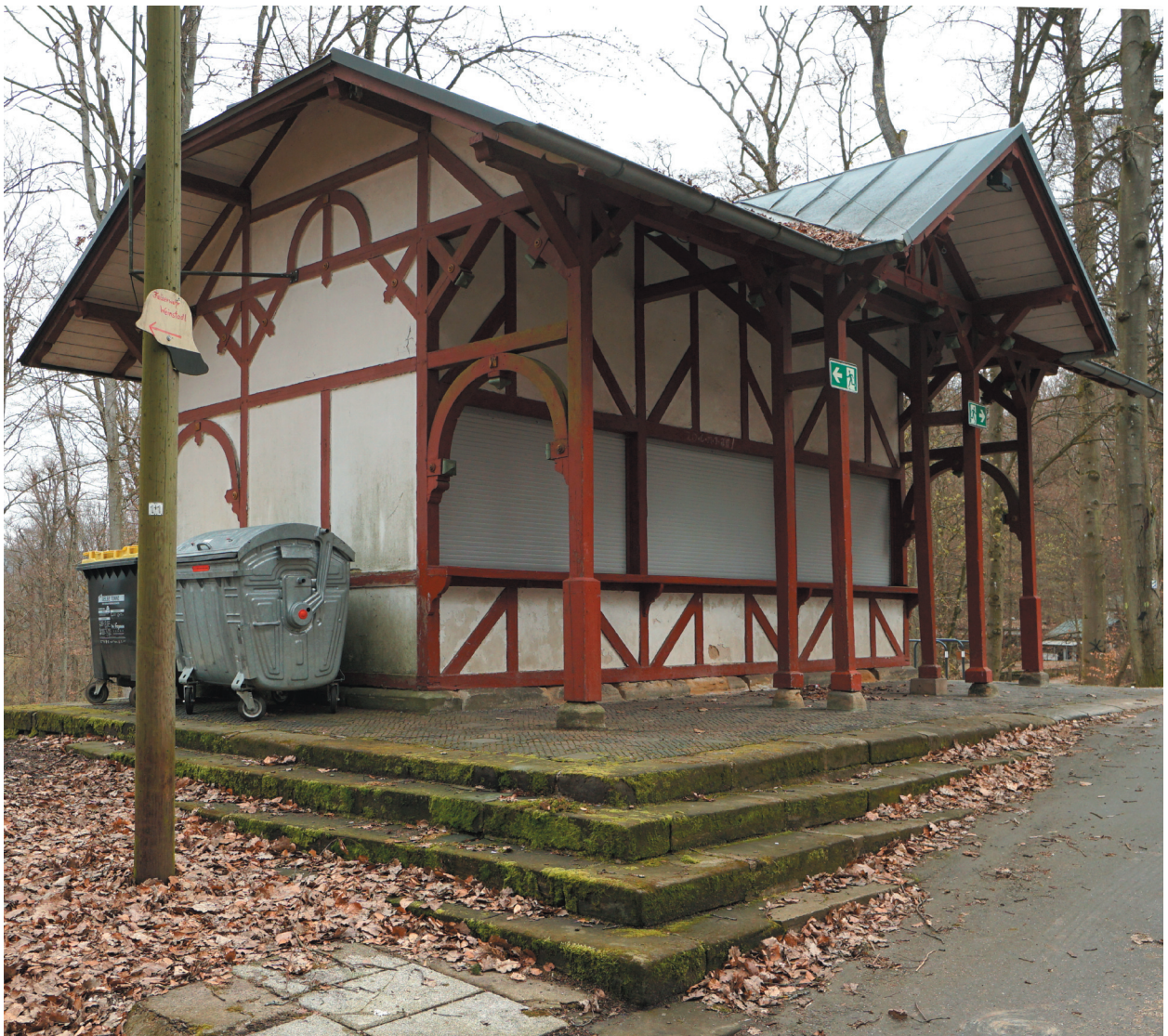
Kiosk, auch genannt „Glücksbude“, Ansicht von Westen