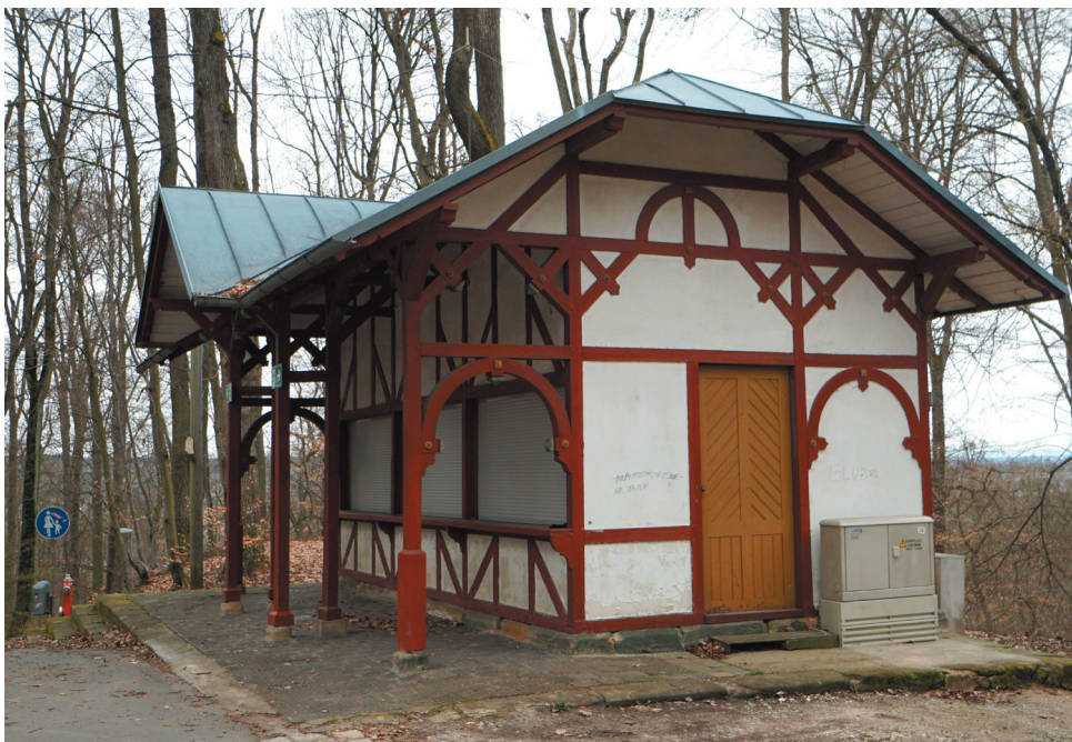
Kiosk (Glücksbude), Ansicht von Osten, © memvier 2023