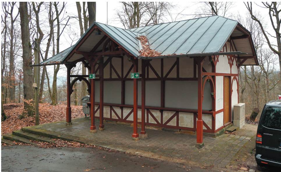
Kiosk (Glücksbude), Ansicht von Süden