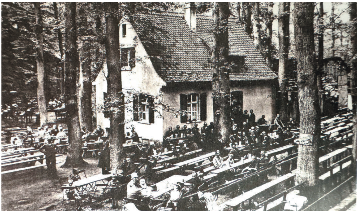
Hoffmanns-Keller 1937 (Glas 2019, 347)