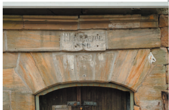
Inschrift über dem Kellereingang, © memvier 2023