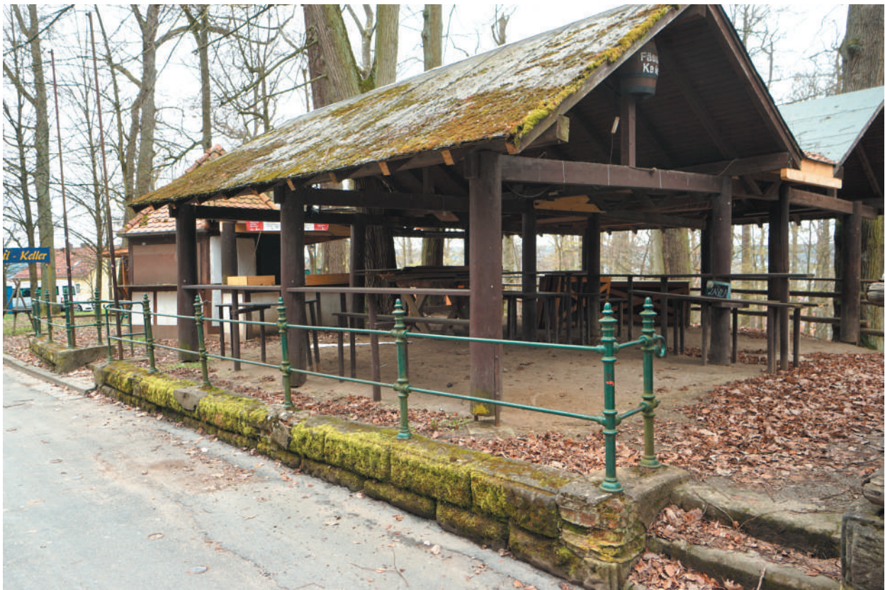
Bierhalle in Hlzbauweise auf Stützen aus Rundstämmen