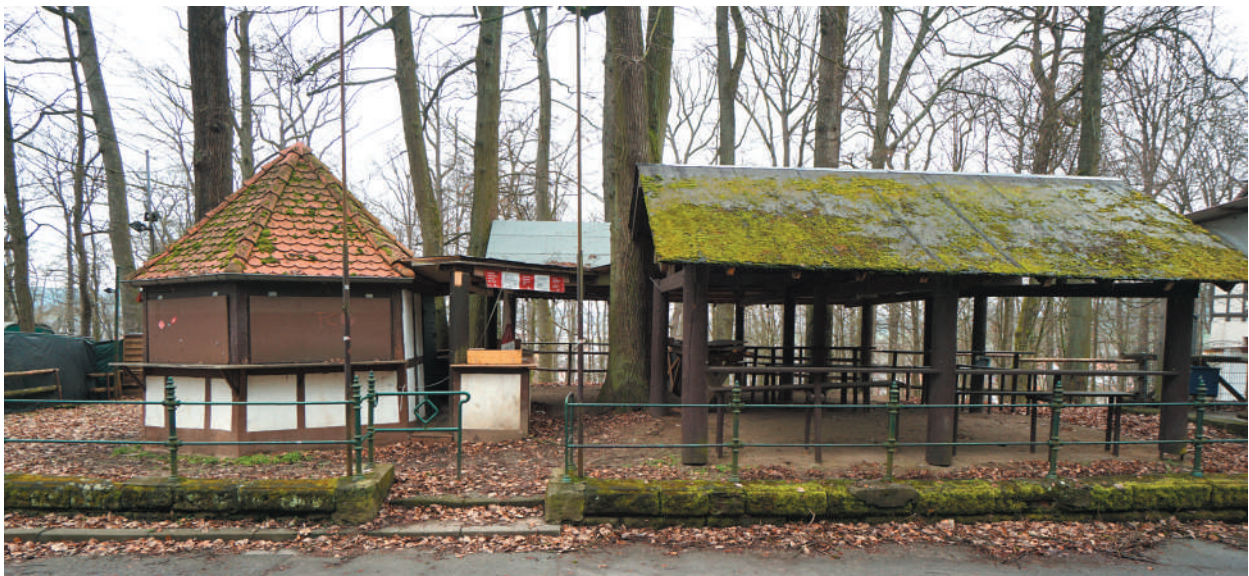
Schachhaus und Bierhalle, Ansicht von Südosten