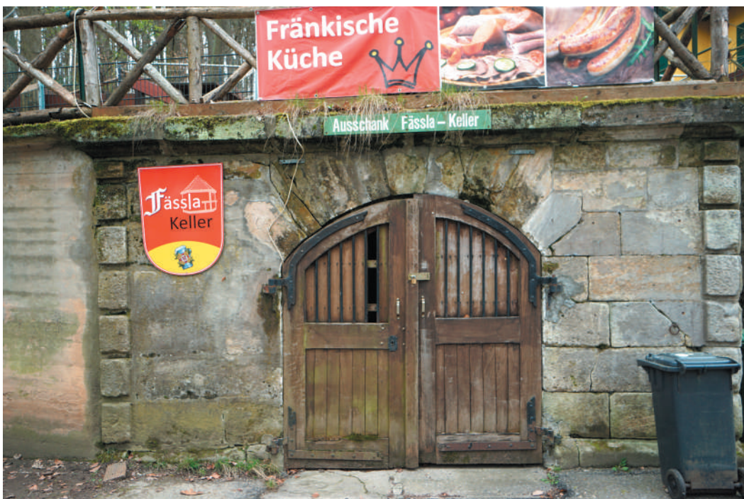
Eingang Felsenkeller, Ansicht von Nordwesten