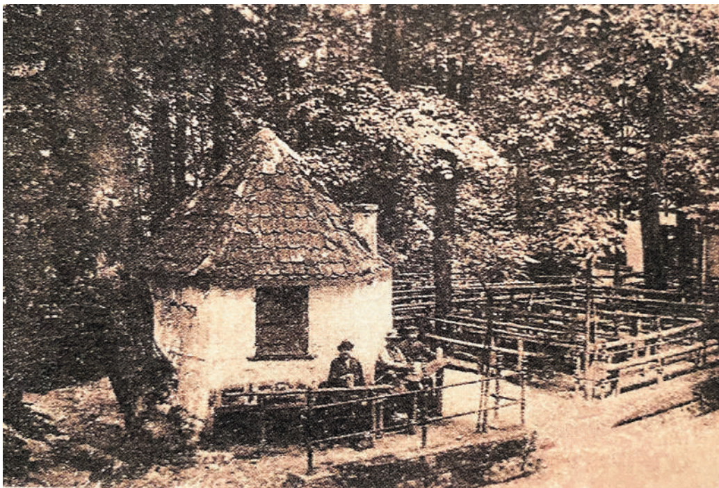
Fässla-Keller, Ausschankhäuschen mit Schankplatz, 1913. (Glas 2019, 266)