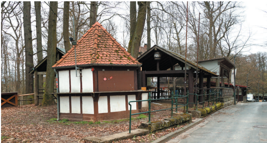
Ausschankhaus mt Bierhalle