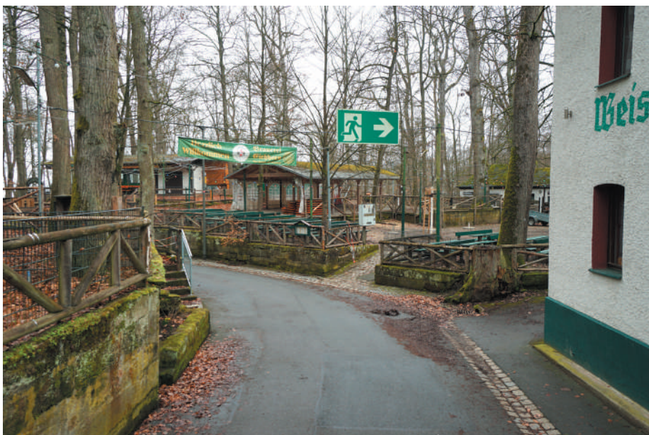
Obere Kellerstraße mit Blick auf die Freischankfläche des Eichhorn-Kellers