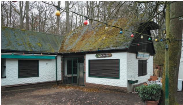
Kellerhaus, Ansicht von Norden