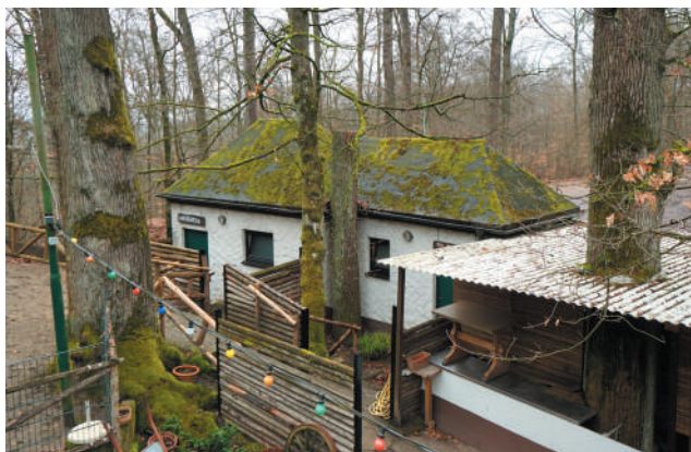
Toilettenhaus, Ansicht von Südwesten