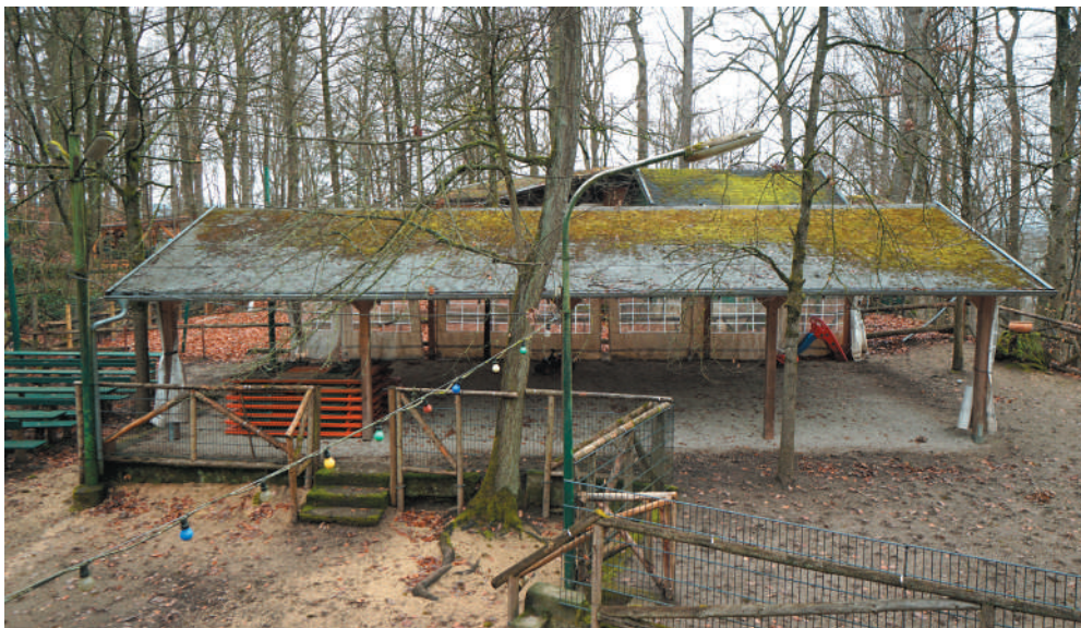
Bierhalle in Holzständerbauweise