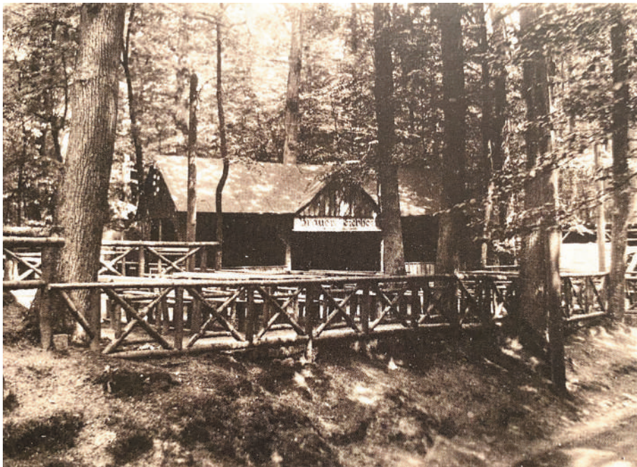
Eichhorn-Keller, um 1939 (Glas 2019, 330)