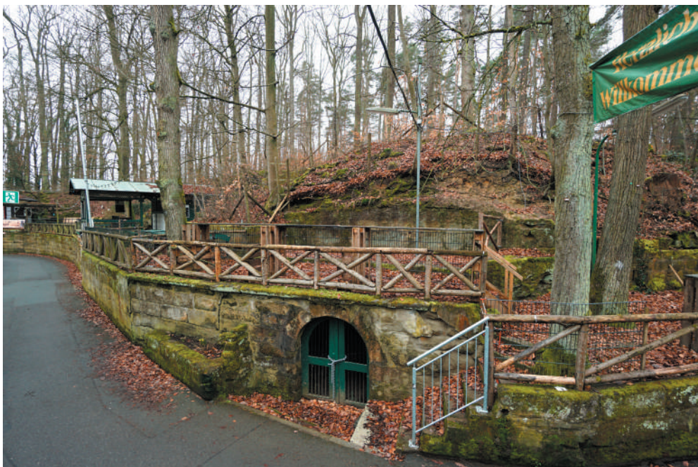
Zugang zum Felsenkeller