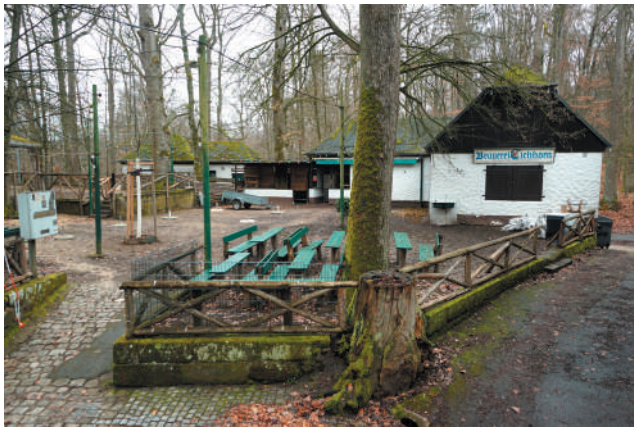
Freischankfläche mit Kellerhaus, Ansicht von Westen