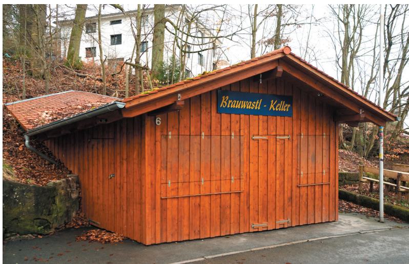
Schankhaus, Ansicht von Norden

Quellen: R. Glas, Biertradition in Forchheim. Zur Geschichte der Schankstätten, Brauereien und Felsenkeller, 2019. Untersuchungsbericht memvier vom 25.03.2024. u. a.