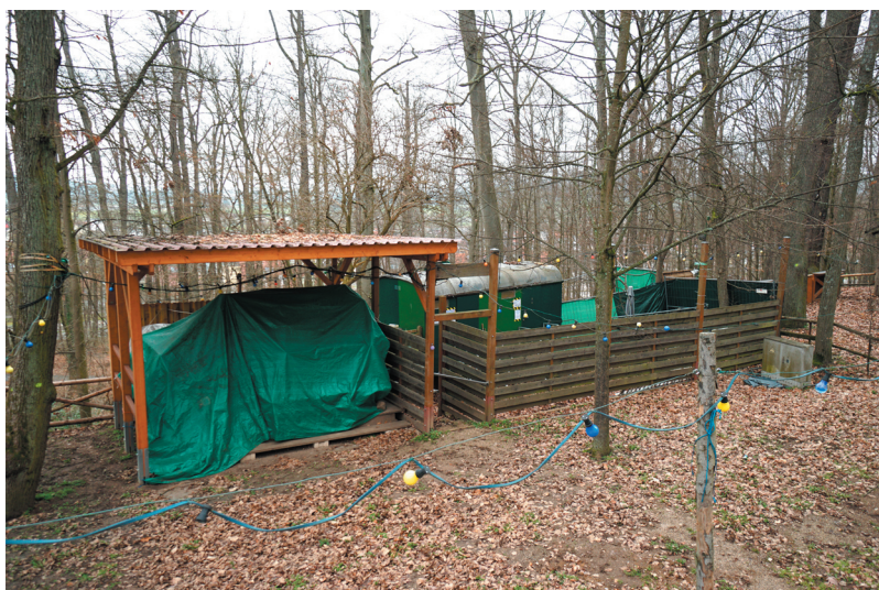
Musikpavillon, Ansicht von Süden