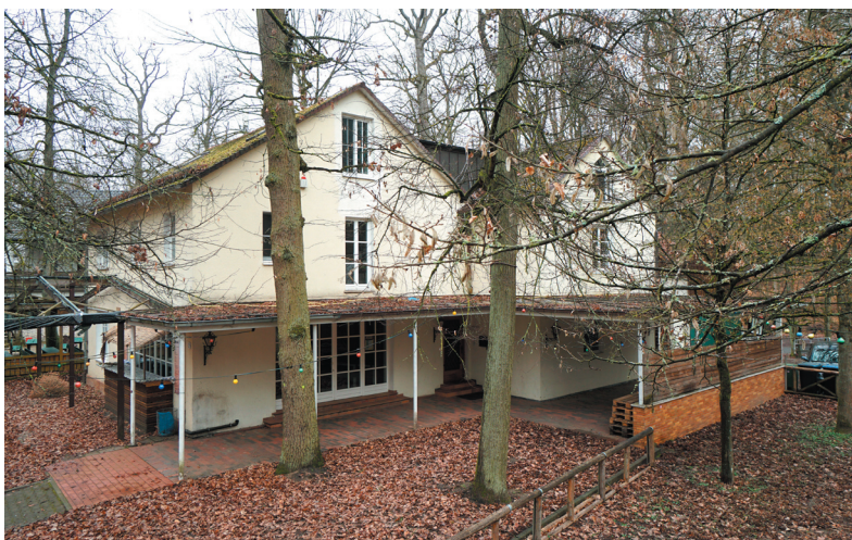
Erweitertes Wirtschaftsgebäude, Ansicht von Süden