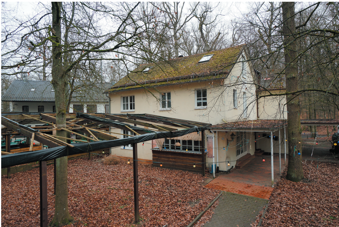
Ansicht von Westen