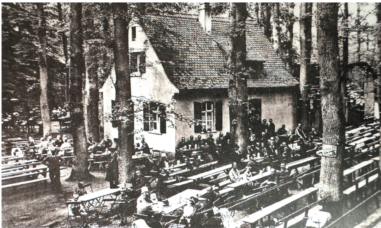
Hoffmanns-Keller 1937 (Glas 2019, 347)