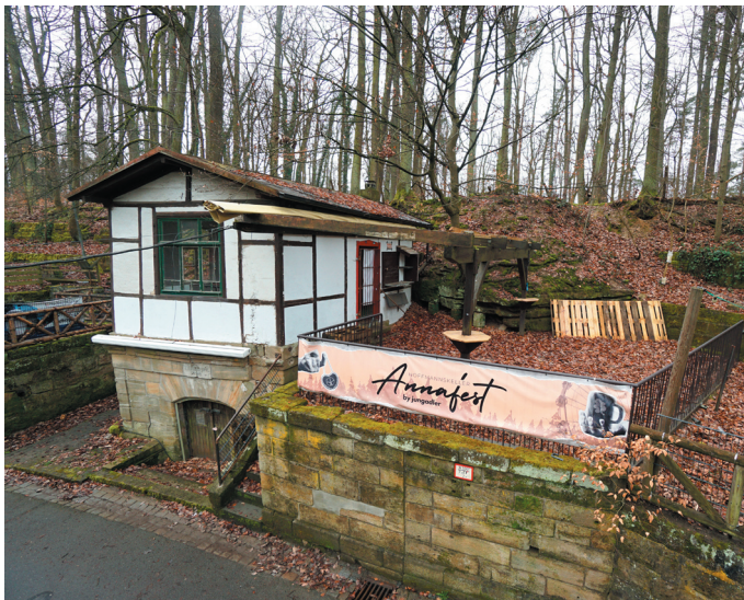
Kellereingang, Ansicht von Nordosten