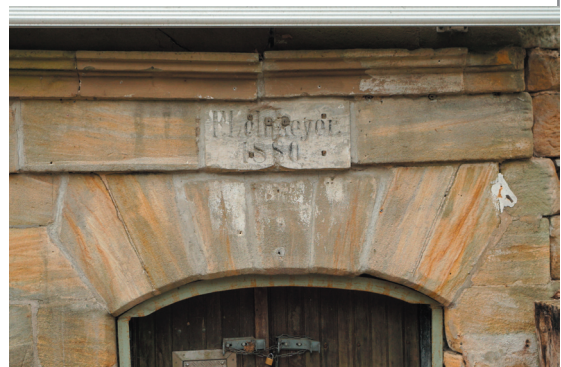
Inschrift über dem Kellereingang