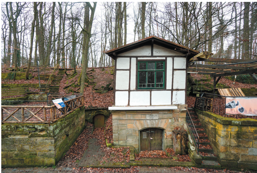
Kellereingang mit Kellerhaus, Ansicht von Osten