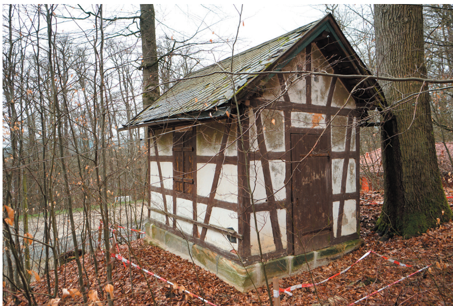
Kellerhäuschen, Ansicht von Süden

Quellen: R. Glas, Biertradition in Forchheim. Zur Geschichte der Schankstätten, Brauereien und Felsenkeller, 2019. Untersuchungsbericht memvier vom 25.03.2024. u. a.