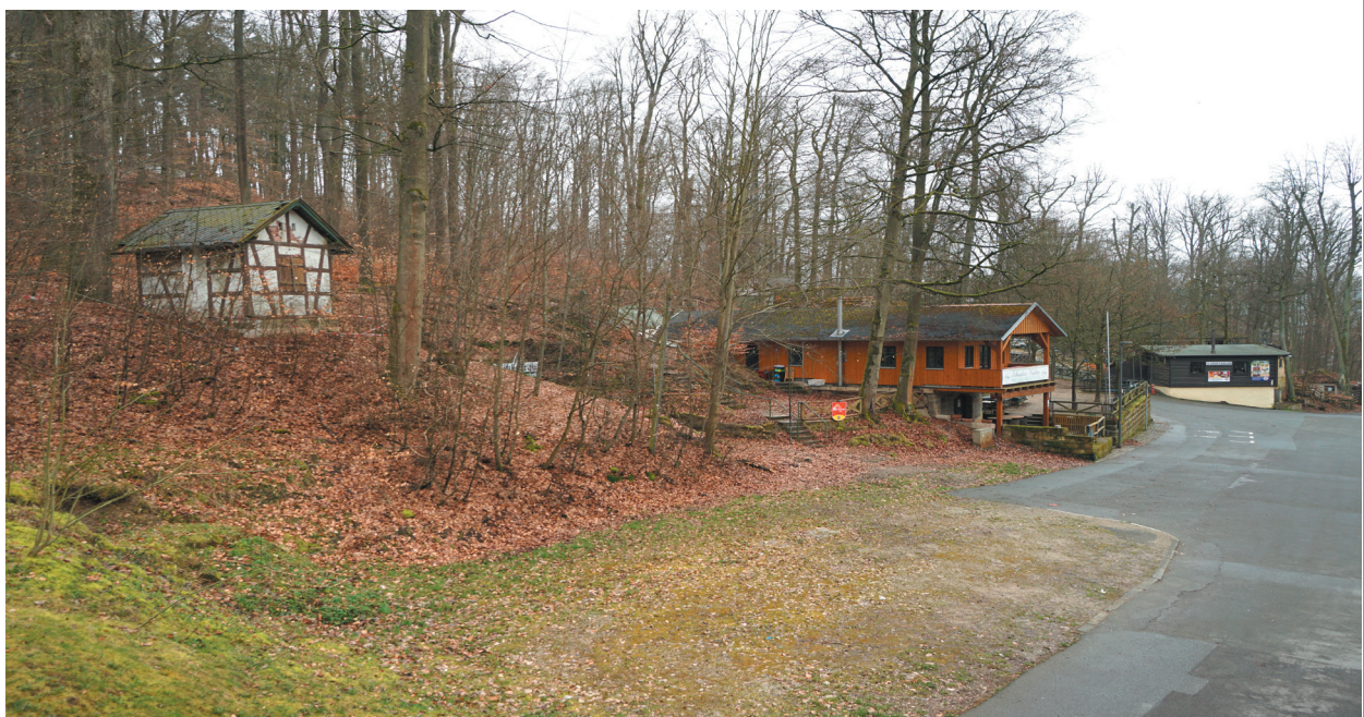
Ansicht von Nordosten mit Kellerhäuschen des Nürnberger-Tor-Kellers im Vordergrund

Der Keller entsteht ab 1709. 1922 ist bereits ein Schankplatz vorhanden. 1925 wird das ehemalige Kellerhäuschen vom Schöffbräu-Keller hier aufgestellt. 1936 entsteht auf dem hinteren Felsenkeller eine Abortanlage, die heute nicht mehr besteht.