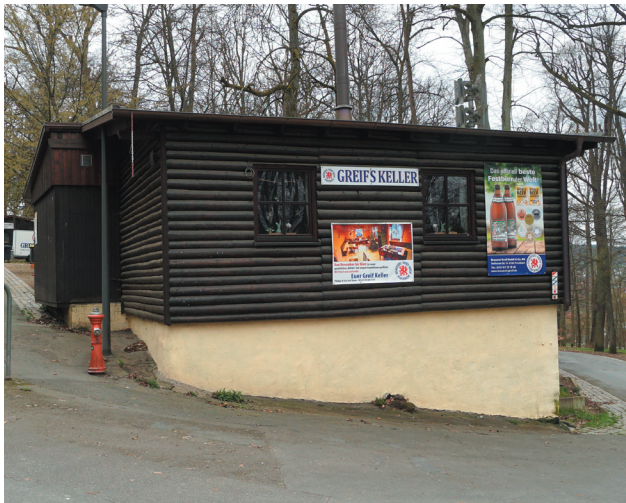
Blockhaus, Ansicht von Osten