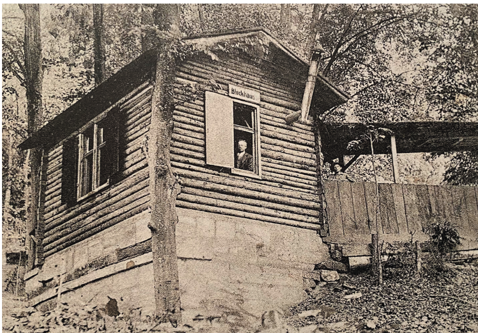
Blockhaus des Greif-Kellers, 1906 (Glas 2019, 293)