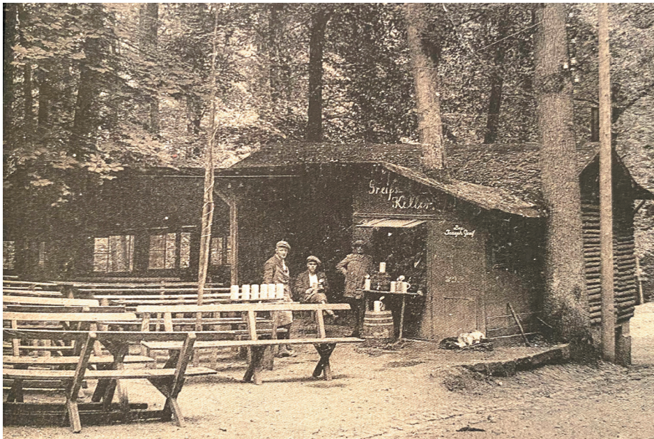
Greif Keller, 1936 (Glas 2019, 293)