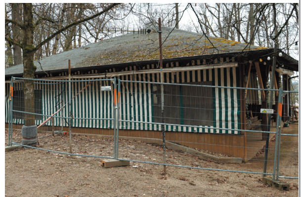
Bierhalle, Ansicht von Süden