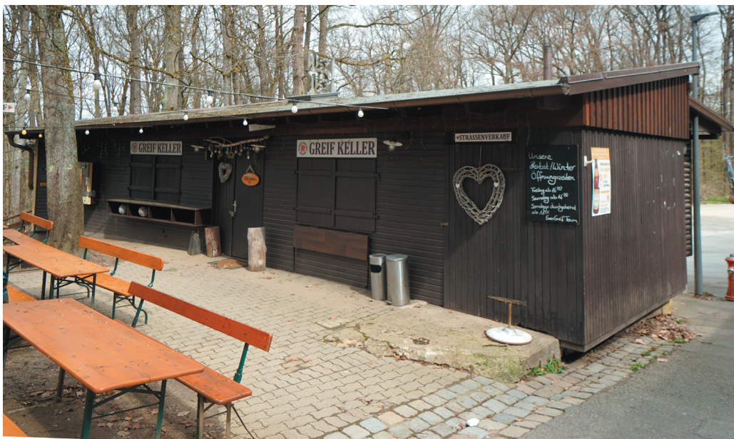
Ausschankhaus auf dem Greif-Keller