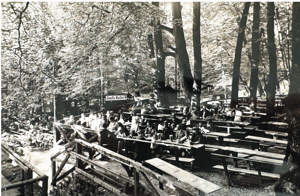
Blick auf den Greif-Keller von der Terrasse des Mahrs-Kellers aus, 1936 (Glas 2019, 304)