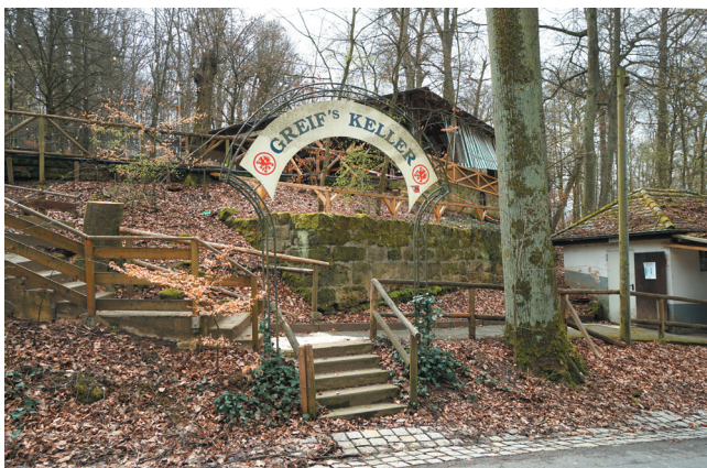
Zugang über Treppen von Norden, © memvier 2023