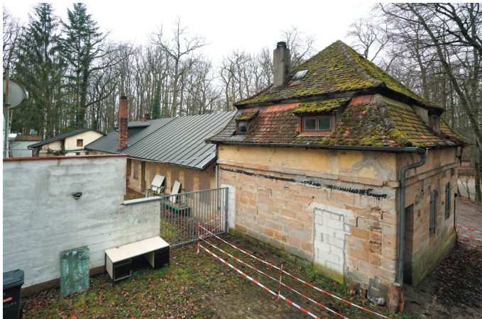
Schützenhaus, Ansicht von Nordosten