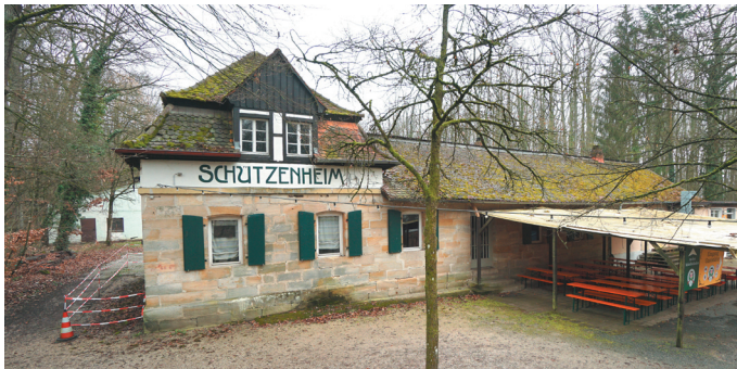
Schützenhaus, Ansicht von Westen