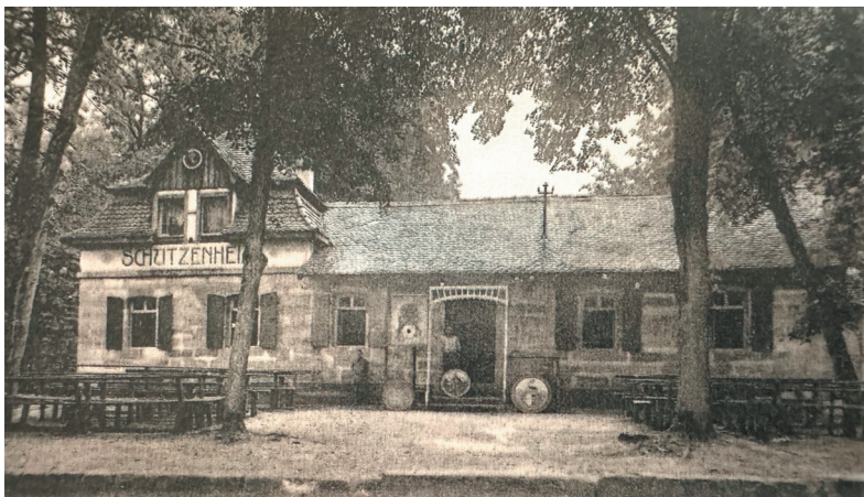
Schützenhaus um 1930 (Glas 2019, 358)