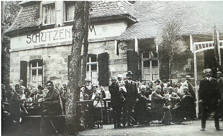
Schützenhaus beim Annafest 1925 (Glas 2019, 357)