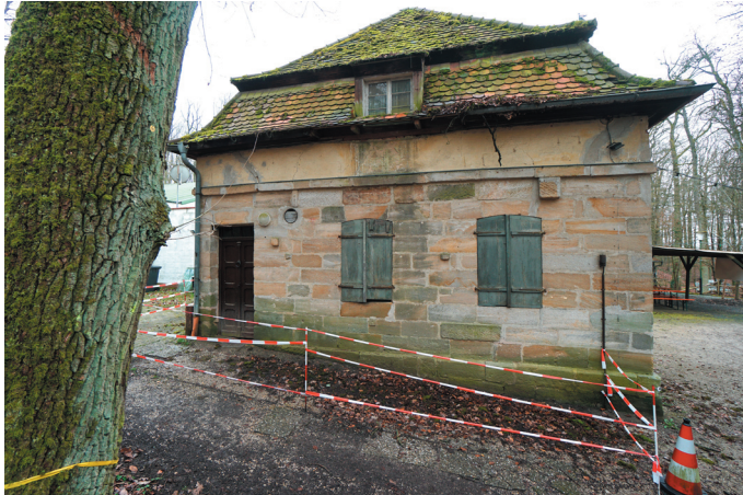
Schützenhaus, Ansicht von Norden, © memvier 2023