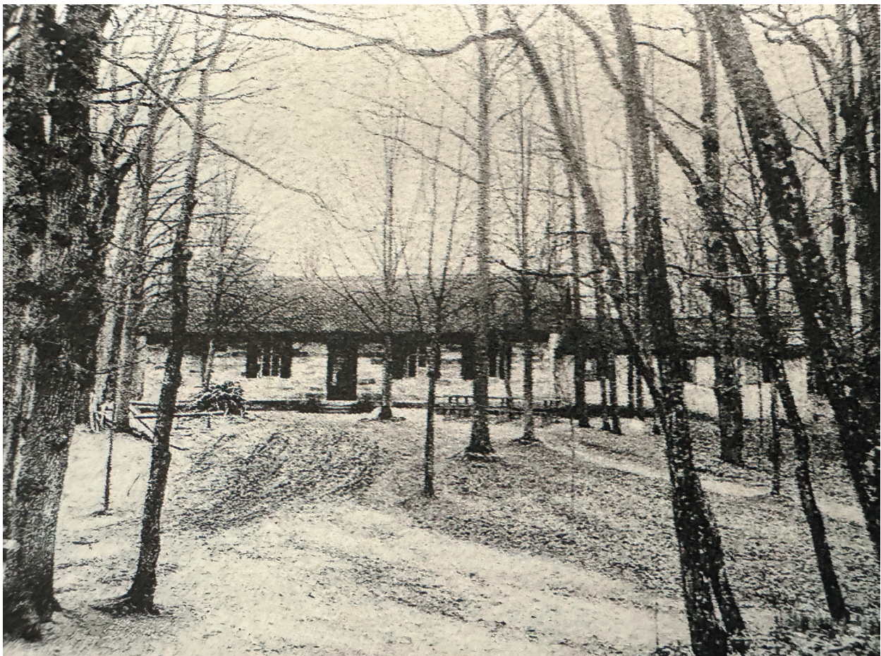
Schützenhaus 1908 (Glas 2019, 356)