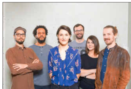
The Jules Band