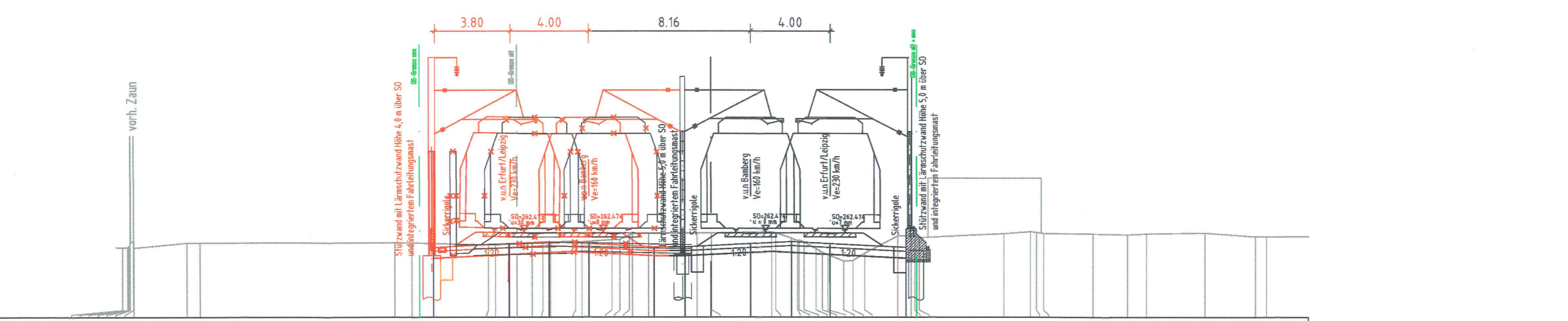
Querprofil 6 39,989