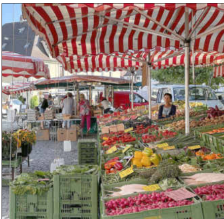
Bauernmarkt in Forchheim