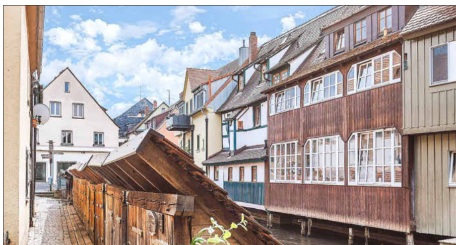
Fischkästen an der Wiesent.

Gute Nachrichten für Forchheim: Die Stadt hat beim prozentualen Zuwachs der Gästeankünfte im Jahr 2022 den ersten Platz erreicht! Mit einem enormen Plus von satten 113,4 Prozent an Ankünften im Vergleich zum Vorjahr überholt die fränkische Königstadt sogar die Stadt Nürnberg (107,6 Prozent) sowie z.B. Rothenburg ob der Tauber (90,2 Prozent). Die erfreulichen Nachrichten für Forchheim hatte der